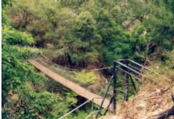
Mitten auf dem „Jenolan River Track“