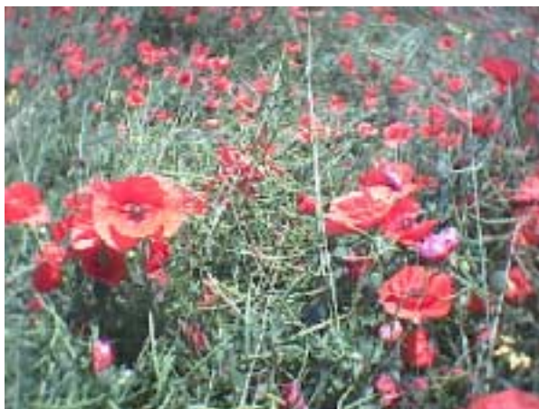
Klatschmohn eine tolle Wiesendeko

Der Inhalt ist mein geistiges Eigentum und darf nur zu privaten Zwecken benutzt oder kopiert werden. © 2003 K.-P. Kuhna (KPKproject)