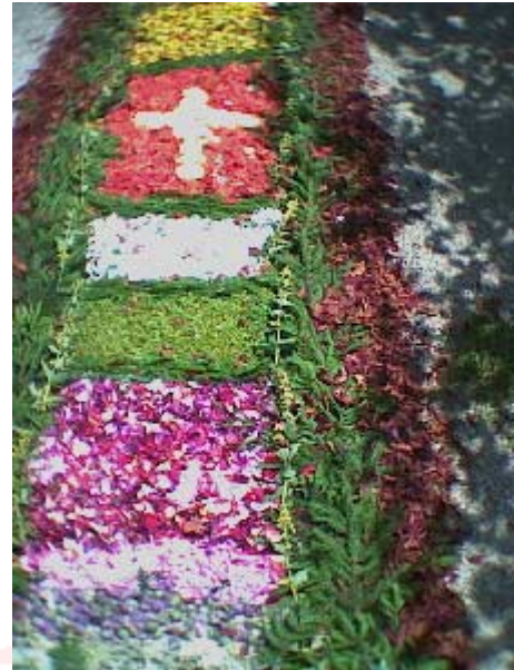
Die farbprächtigen Reste der sattgefunden Fronleichnam- Prozession