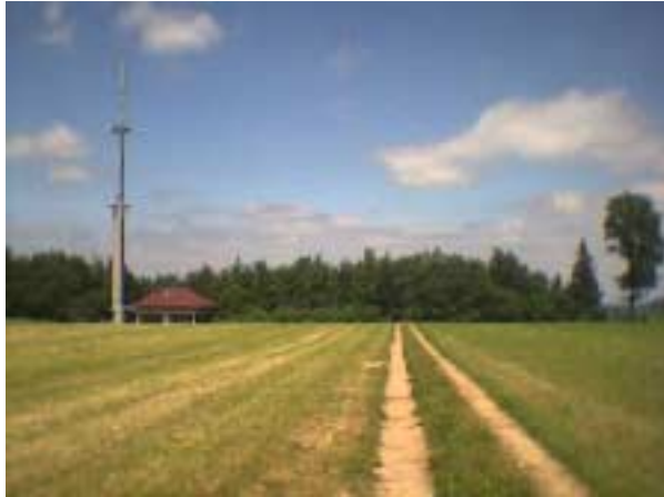
Über Stock und Stein

TITEL: IVV-Veranstaltungen 2003 (BW) – Tuningen – (Öfingen) (Baar-Kreis)