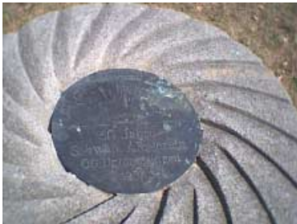
Die „Friedens-Linde“ 1983

Eine Metalltafel erinnert an „50 Jahre Schwäb. Albverein OG Unterensingen“ (1997)