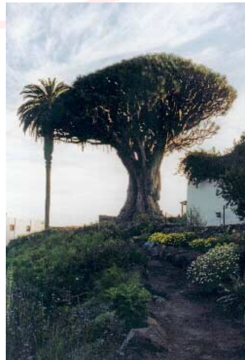
Unten: I cod de los Vinos „Drago Milenario“ Der tausendjährige Drachenbaum gilt als Inselwahrzeichen

Bitte beachten Sie, dass die vorgegebene Zusammenstellung keinen Anspruch auf Vollständigkeit hat und nur beratend zur Seite stehen soll. Der Inhalt ist mein geistiges Eigentum und darf nur zu privaten Zwecken benutzt oder kopiert werden.