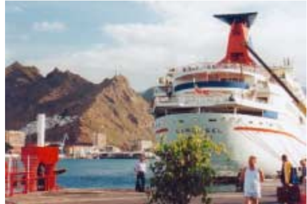
Oben: Der Hafen von Santa Cruz