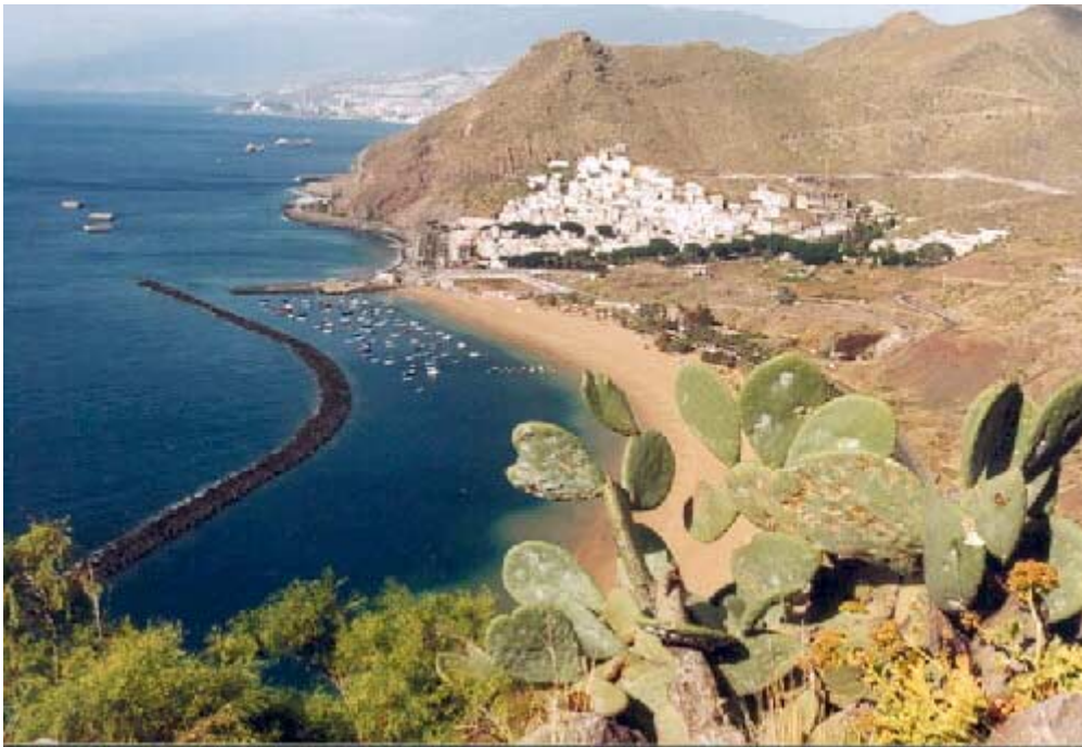
Bei I queste (süd-östlicher Inselteil) im Anaga-Gebirge der Blick in die Ferne nach Santa Cruz

TITEL: Teneriffa (Kanarische Inseln) – Unterwegs auf der Insel – Ein bunter Mix und die Phoenix canariensis