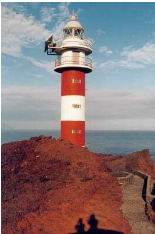
Punta de Teno mit dem Faro de Teno im nord-westlichen Inselbereich

TITEL: Teneriffa (Kanarische Inseln) – Unterwegs auf der Insel – Ein bunter Mix und die Phoenix canariensis